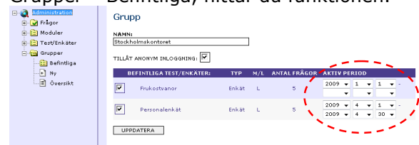
Du kan lägga in datum när det ska vara aktivt.

Du kan bestämma om du vill att ett test eller en enkät ska vara öppen en viss datumperiod för en grupp i ditt projekt. I Administration – Grupper – Befintliga, hittar du funktionen.