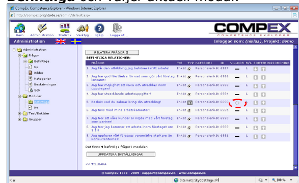
Du kan lägga till villkor till dina frågor.

Du kan nu koppla villkor till frågor. Det innebär att om en person väljer ett visst alternativ på en fråga så kan du koppla ett villkor exempelvis att en extra fråga ska visas. Du lägger till villkor i Moduler – Befintliga och väljer aktuell modul.